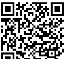
mBank im Google Store

Die GLS mBank App finden Sie für Ihr Tablet und für Ihr Mobiltelefon mit dem Android Betriebssystem im Google Play Store und für iOS bei Apple iTunes.