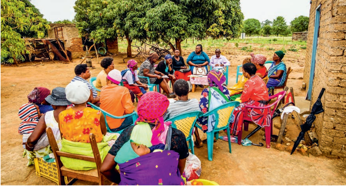
Kundinnen der Small Enterprise Foundation (SEF) in Südafrika

Rebeca Danielle Eyzaguirre Molina: Die Folgen des Klimawandels für die Landwirte in Bolivien und weltweit sind vielfältig und reichen von der Erosion des Landes und der Ackerböden bis hin zum Tod des Viehs aufgrund von Wassermangel oder extremer Hitze. Für Landwirte bedeutet der Verlust ihres Viehs und ihrer Ernte unmittelbar einen beträchtlichen wirtschaftlichen Verlust. Die Ernährungsunsicherheit in Bolivien ist an zwei Fronten beeinflusst: einerseits durch den Verlust von Ernten, die für die Ernährung der Bevölkerung bestimmt sind, und andererseits durch den entstehenden individuellen Einkommensverlust, der den Zugang zu Nahrungsmitteln erschwert.