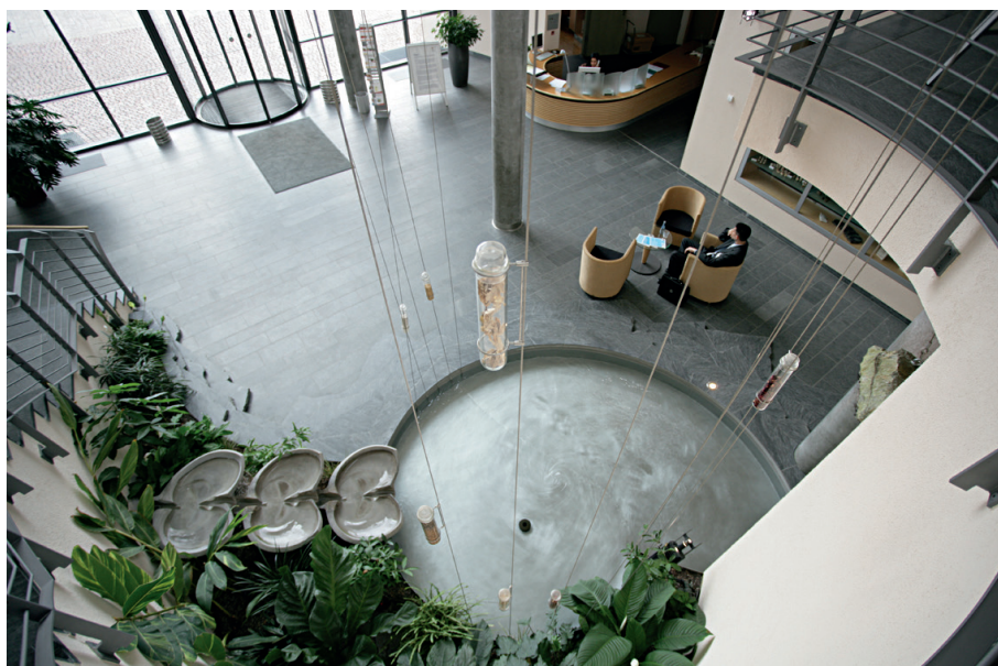
Foyer der WALA Heilmittel GmbH

Sprechen Sie uns an und berichten Sie uns von Ihrem Vorhaben. Sie treffen auf ein bundesweit aktives Team von Spezialistinnen und Spezialisten.