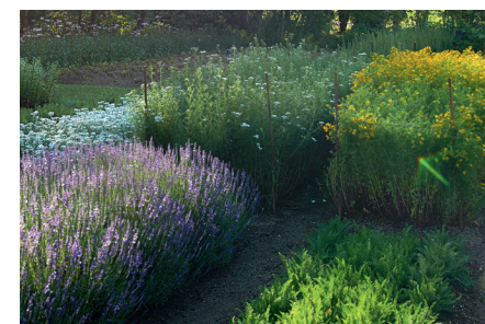
Lavendel, Edelweiß, Johanniskraut und Schafgarbe im WALA Heilpflanzengarten