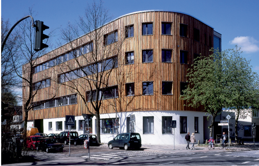
Handwerkerhof Ottensen Verwaltungs- gesellschaft mbH

Nachhaltigkeit – ein Begriff der heute in aller Munde ist. Zahlreiche Unternehmen aus allen Bereichen des alltäglichen Lebens haben sich auf den Weg gemacht, ihre Produkte und Dienstleistungen nachhaltig und sozial-ökologisch auszurichten.